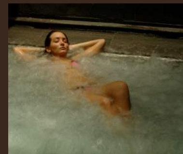
Grotta azzurra e vasca del mare