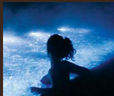
Winter Pool all'aperto